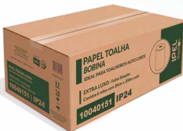
TOALHA BOBINA IPEL TRACTION 23 a 25g 10040151 - 20cm x 200m 6 rls - Extra Luxu EAN: 789.985380431.5