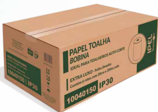
TOALHA BOBINA IPEL TRACTION 29 a 31g 10040150 - 20cm x 200m 6 rls - Extra Luxu EAN: 789.985380423.0

Desenvolvidas especialmente para toalheiros auto corte.