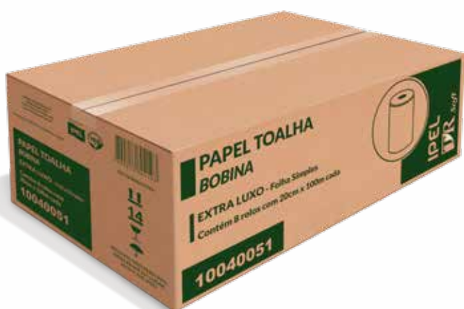
TOALHA BOBINA IPEL TR SOFT 33 a 35g 10040051 - 20cm x 100m 8 rls - Extra Luxu EAN: 789.800671759.5 10040056 - 20cm x 200m 6 rls - Extra Luxu EAN: 789.985380051.5