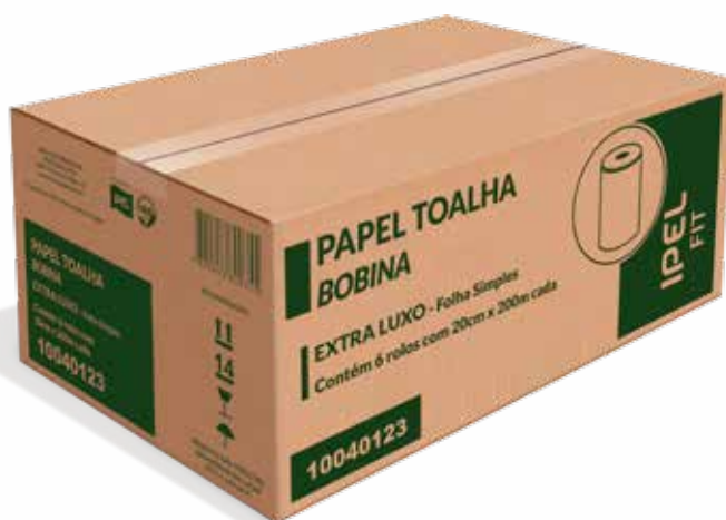
TOALHA BOBINA IPEL FIT 18 a 20g 10040123 - 20cm x 200m 6 rls - Extra Luxu EAN: 789.985380035.5

TODOS FEITOS COM 100% DE CELULOSE VIRGEM.